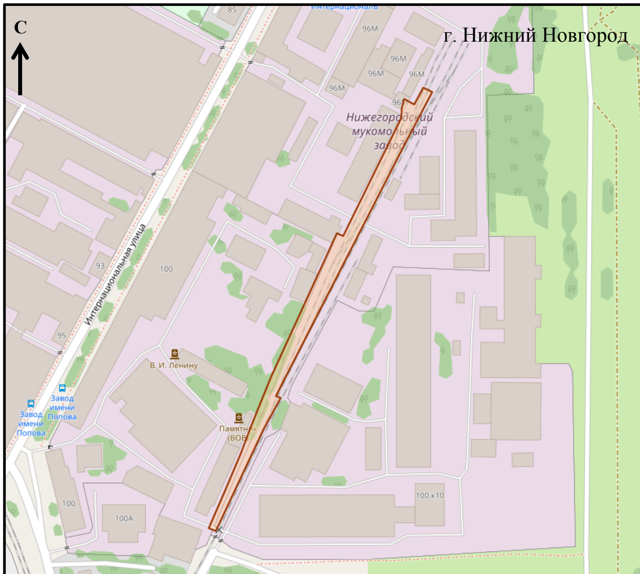
Схема границ подготовки документации по планировке территории (арх. № 282/21)